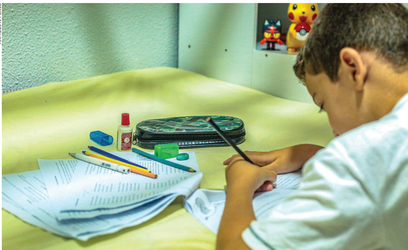
Para especialistas, o ensino remoto aprofundou as desigualdades sociais por conta do limitado acesso à internet e a dispositivos