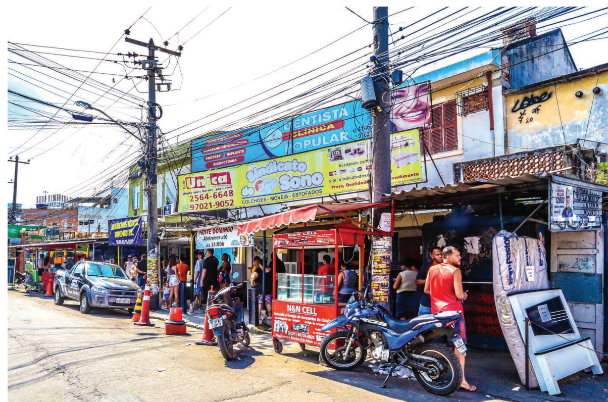
Como moradores muitas vezes não têm para onde correr, é comum que filas enormes se formem nas casas lotéricas do conjunto de favelas

O relato dela retrata o analfabetismo digital — quando uma pessoa não sabe como funcionam smartphones, computadores e internet. “Minha mãe tinha um celular, mas de três anos para cá percebemos o distanciamento do aparelho. Agora ela só usa o telefone