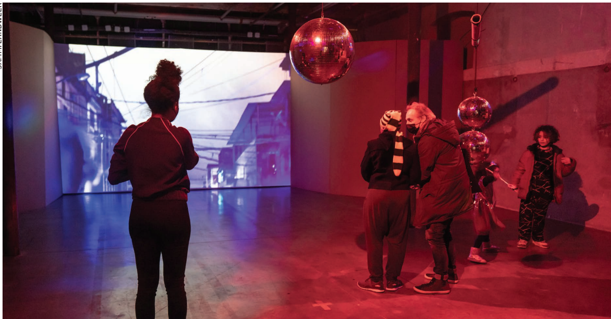
Um dos destaques da exposição Viva Maré foi o diálogo com o público francês por meio de oficinas de arte com materiais diversos

mareenses. Tendo como tema-disparador a pergunta O que me faz ter vontade de existir? , as oficinas de arte propuseram um encontro artístico e territorial entre os moradores da Maré e o público do Centquatre-Paris.