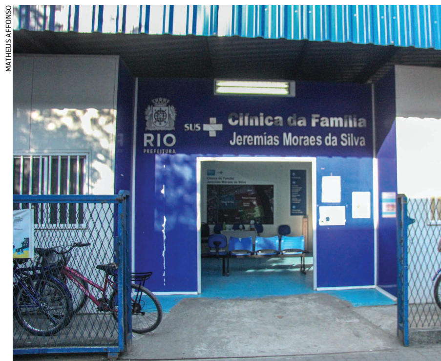
Nas unidades de saúde da Maré, os atendimentos para casos de gripe superaram os de covid-19

“Esse tumulto poderia ter sido evitado”, afirma uma agente de saúde da Jeremias, que preferiu não se identificar. “Quando a campanha começou em abril, fomos até a população, para a rua, montamos tendas, chamamos as pessoas para se vacinarem e eram pouquíssimas as que vinham.”