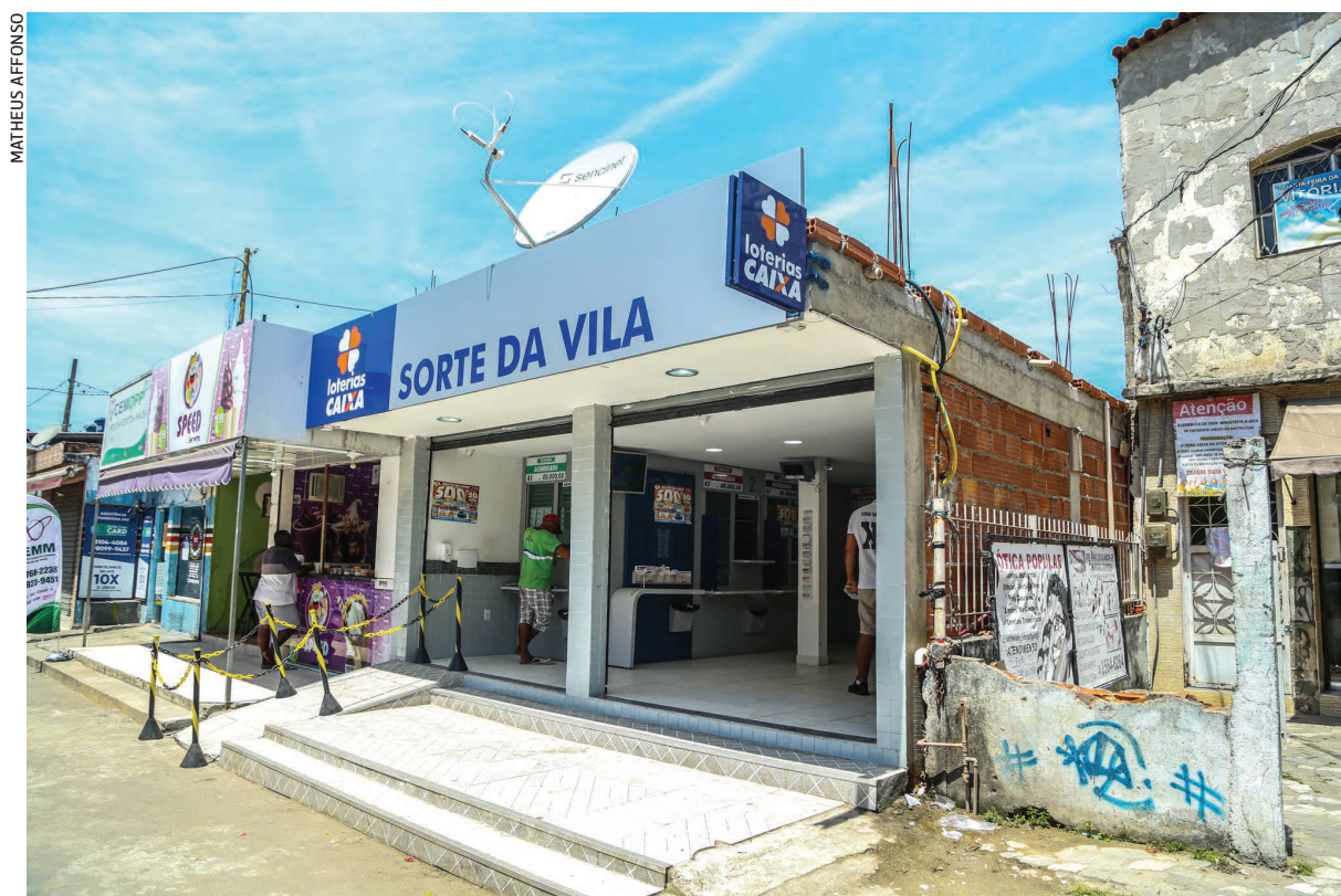
Apesar de a periferia movimentar quase R$ 120 bilhões por ano, nas favelas não há agências bancárias; a solução é usar as lotéricas, como na Maré

Na Maré, apenas o Banco 24 Horas disponibiliza máquinas em seis pontos do comércio local. São dois na Praia de Ramos, um na Vila dos Pinheiros, um no Morro do Timbau e dois na Avenida Brasil, na proximidade da Nova Holanda. Até o mês de setembro, apenas a Loteria Alvorada, localizada na Rua