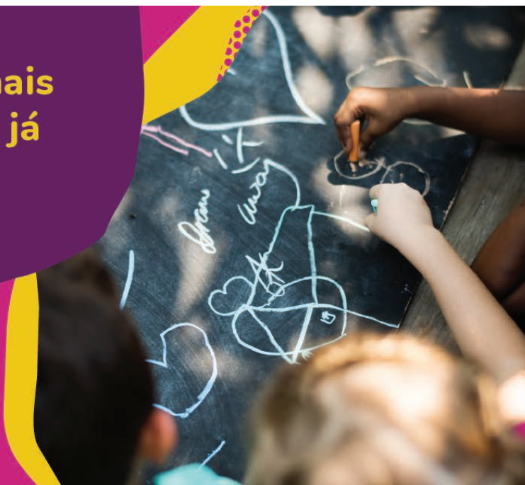
Arte promocional da campanha Bora pra escola! , que tem como objetivo convencer estudantes a retornarem ao ambiente escolar